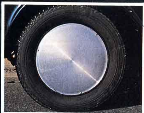
Et si rien ne vous plaît, il reste un truc, une astuce : les moon-discs. Alu ou poly, chacun y trouvera son compte. Environ 600 F les quatre (c'est pas cher). Chez LS Auto.