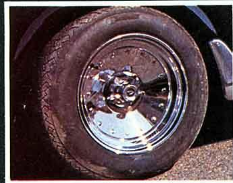
Appliance Bandit. Un ancien modèle. Maintenant, elle se présente avec des trous en 4 couleurs (blancs, argent, or, chrome). Une très belle jante, malheureusement un peu lourde. De 5,5 x 13 à 8 x 15. Prix selon les modèles.