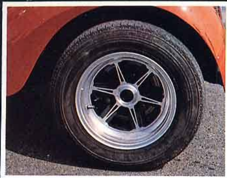
Targa. Encore une ancienne roue pour R8 Gordini.