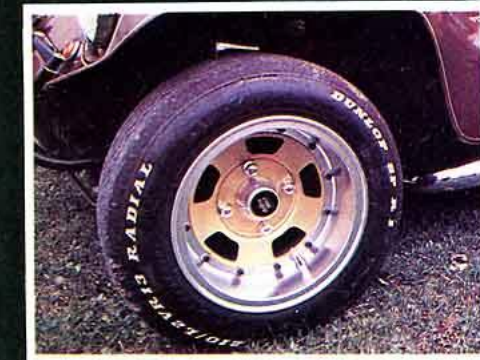
Delta-Mics. Démontable. Une roue française.