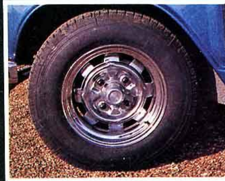
Mangels chromées. Spéciales Coccinelle, mais elles s'adaptent aussi sur l'Aronde en bricolant les goujons, sachez-le !!