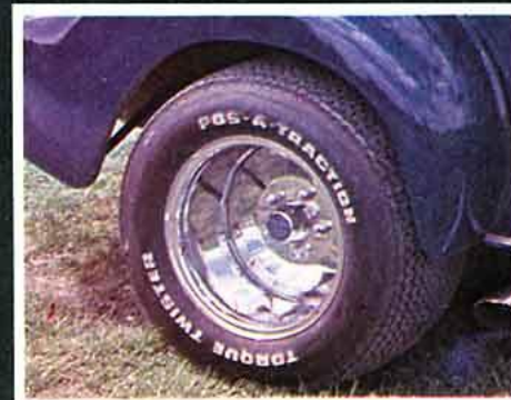
Cragar. La vraie jante de drag, ou presque. La classe internationale, introuvable malheureusement. Il y a cependant des imitations avec les Deltaline de chez Delta-Mics.