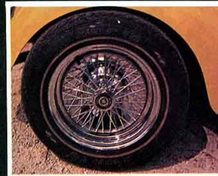
Copacabana. Ne vous laissez pas berner, ce n'est qu'un enjoliveur à rayons. De 5,5 x 13 (626 F) à 7 x 15 (738 F).