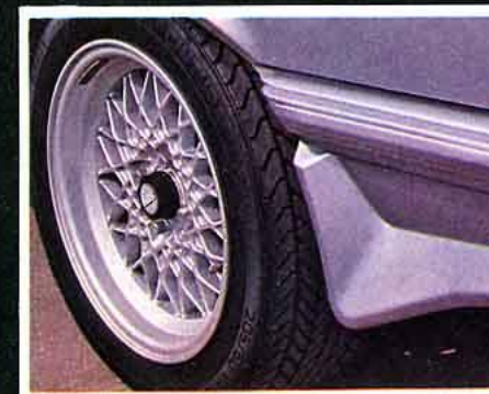
BBS. Une chouette roue pour Porsche et Mercedes. Le look allemand.