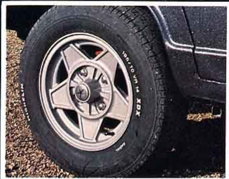
Cromodora. Italienne, peu répandue. Le style italien dans toute sa splendeur, un p'tit air de Ferrari.