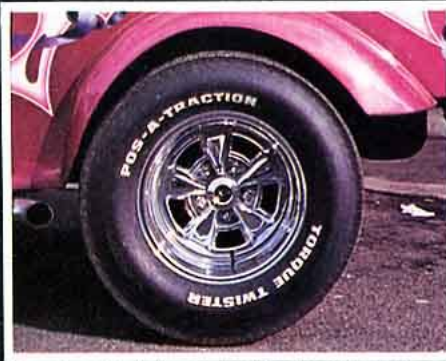
Suprême Cal chromé, de 5,5 x 13 à 10 x 15 (de 600 à 850 F pièce). Attention, le chrome est fragile. Entretien soigné obligatoire.