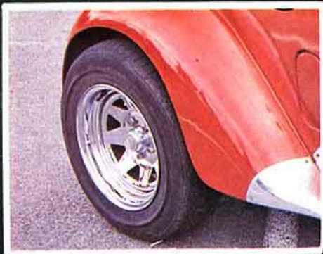
8 branches chromées. Ce sont les plus répandues, car les moins chères, de 5,5 x 13 à 7 x 16 en chromées (prix approximatif, de 477 à 635 F pièce). Existent aussi en blanc, de 5 x 10 à 7 x 16 (de 280 à 390 F pièce). Jantes bas de gamme, lourdes et peu résistantes.