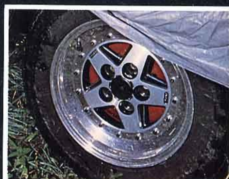
Gotti démontable montée sur Trianon. Un nouveau style. A creuser.