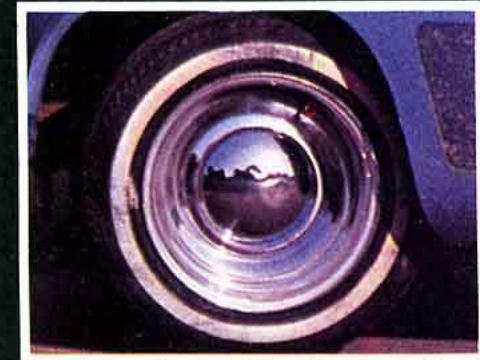
Smoothies. Chrome étincelant, pneus à flancs blancs, la roue parfaite pour un leadsled. Taille : de 6 x 14 à 10 x 15 (moins de 700 F pièce).