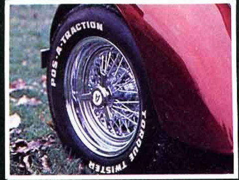
True Spokes. La grande classe pour resto rods ou low riders, de 6 x 14 à 10 x 15. Le prix est en rapport avec la beauté (de 1 900 à 2 350 F pièce). Un défaut cependant, l'entretien est fastidieux.