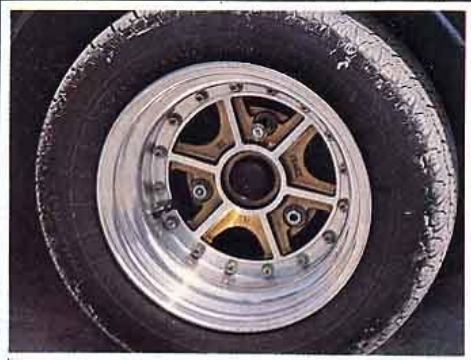
Delta-Mics, démontable et ultra-légère. Y'a pas, c'est un style...