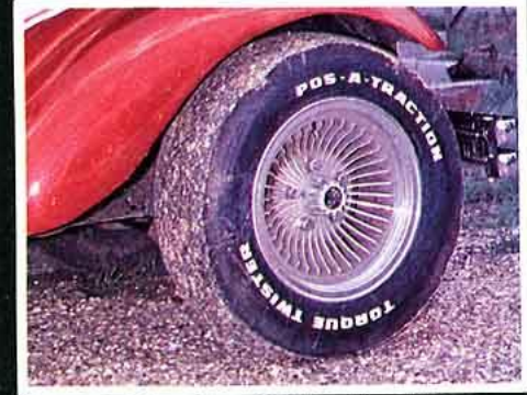
Serpent 32, marque Shelby. Une très belle roue monobloc en alu, de 5,5 x 13 à 8,5 x 15 (785 à 1 040 F pièce).