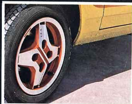
Gotti JLL (Jean-Louis Lafosse). Une jante moderne pour véhicules récents.