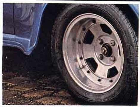
PLS démontable. Un goût de compétition. Cette roue a équipé beaucoup de protos Renault. On la trouve encore dans les petites annonces d'Échappement. Un avantage certain, le poids : ultra-légère.