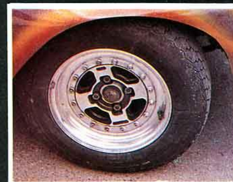
PLS démontable. Toujours française, un style bien de chez nous.