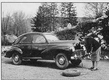
Euh, le cric, je le mets où ? Pratique, pourtant, les six points d'ancrage, malheureusement souvent corrodés.